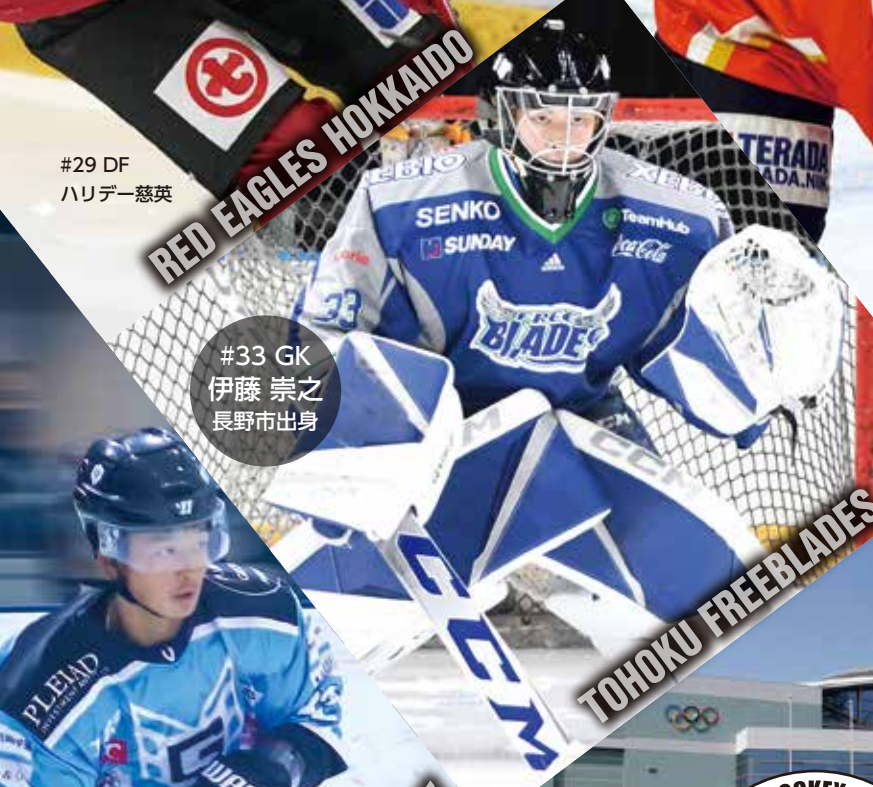
#33 GK 伊藤 崇之 長野市出身